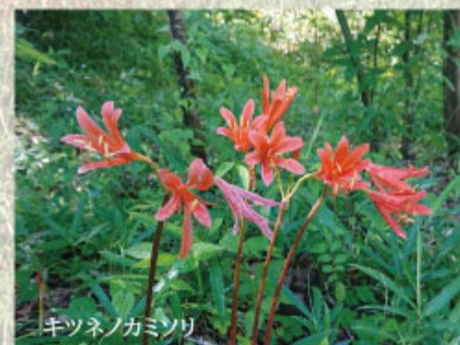
キツネノカミソリ

「オーレア」とも呼ばれる品種で、ピンク系や白、赤が多いリコリスのなかでも一層目を惹くのが、この品種です。鮮やかな黄色はひとつひとつの花弁が大ぶりです。こちらも、9月頃から果樹園でみられます。