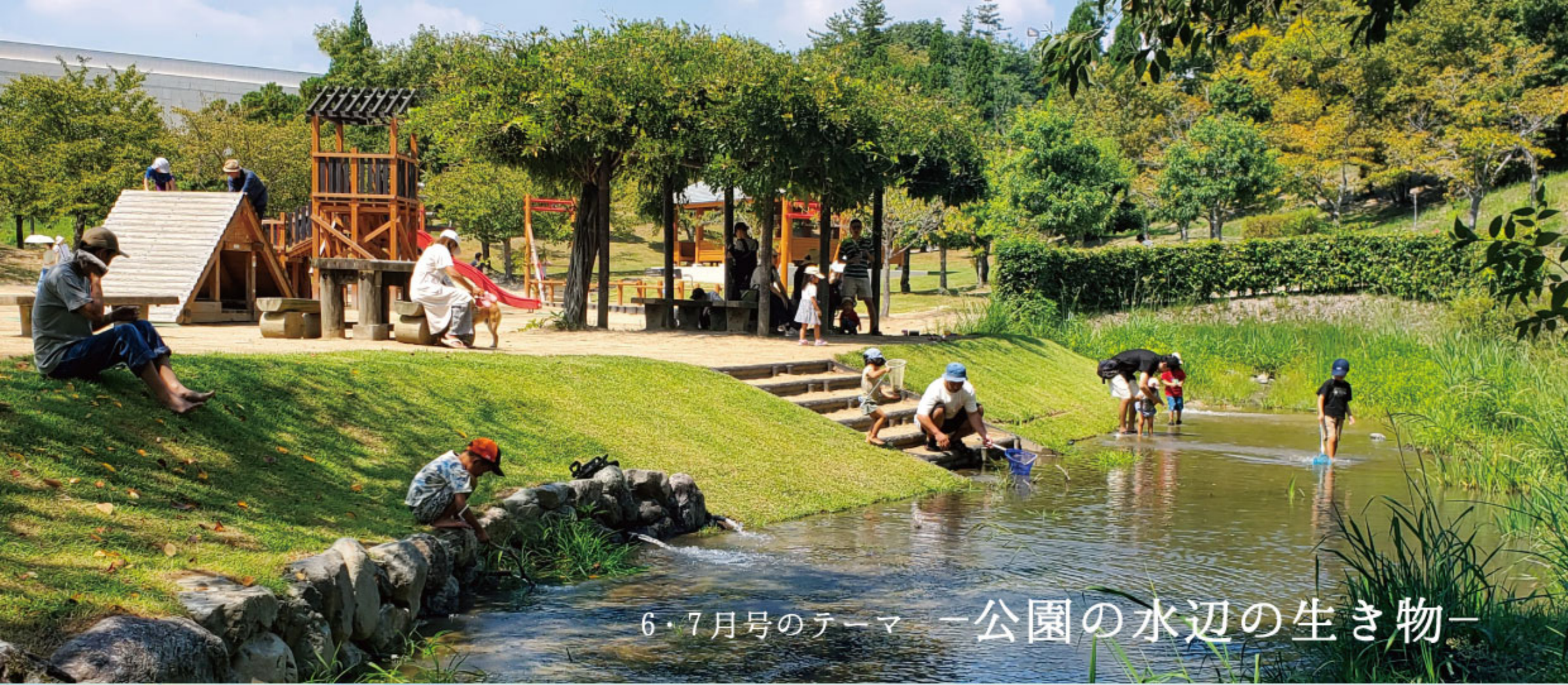
6・7月号のテーマ「公園の水辺の生き物」