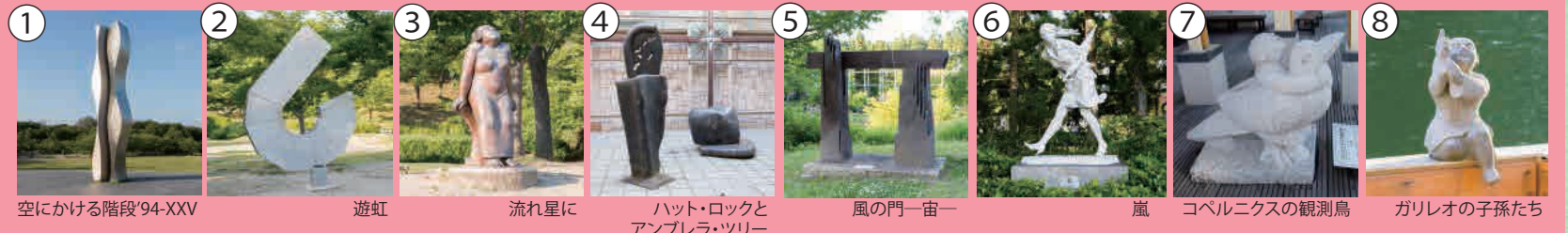
① 空にける階段'94-XXV ② 遊虹 ③ 流れ星に ④ ハット・ロックとアンブレラ・ツリー ⑤ 風の門一宙一 ⑥ 嵐 ⑦ コペルニクスの観測鳥 ⑧ ガリレオの子孫たち

芽ぶきの森のおたのしみ② 晩秋になると永谷池にはオンドリやマガモがやってきます。