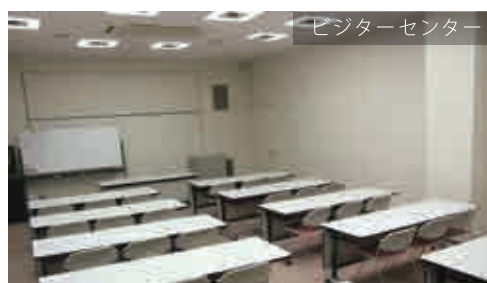
ビジターセンター