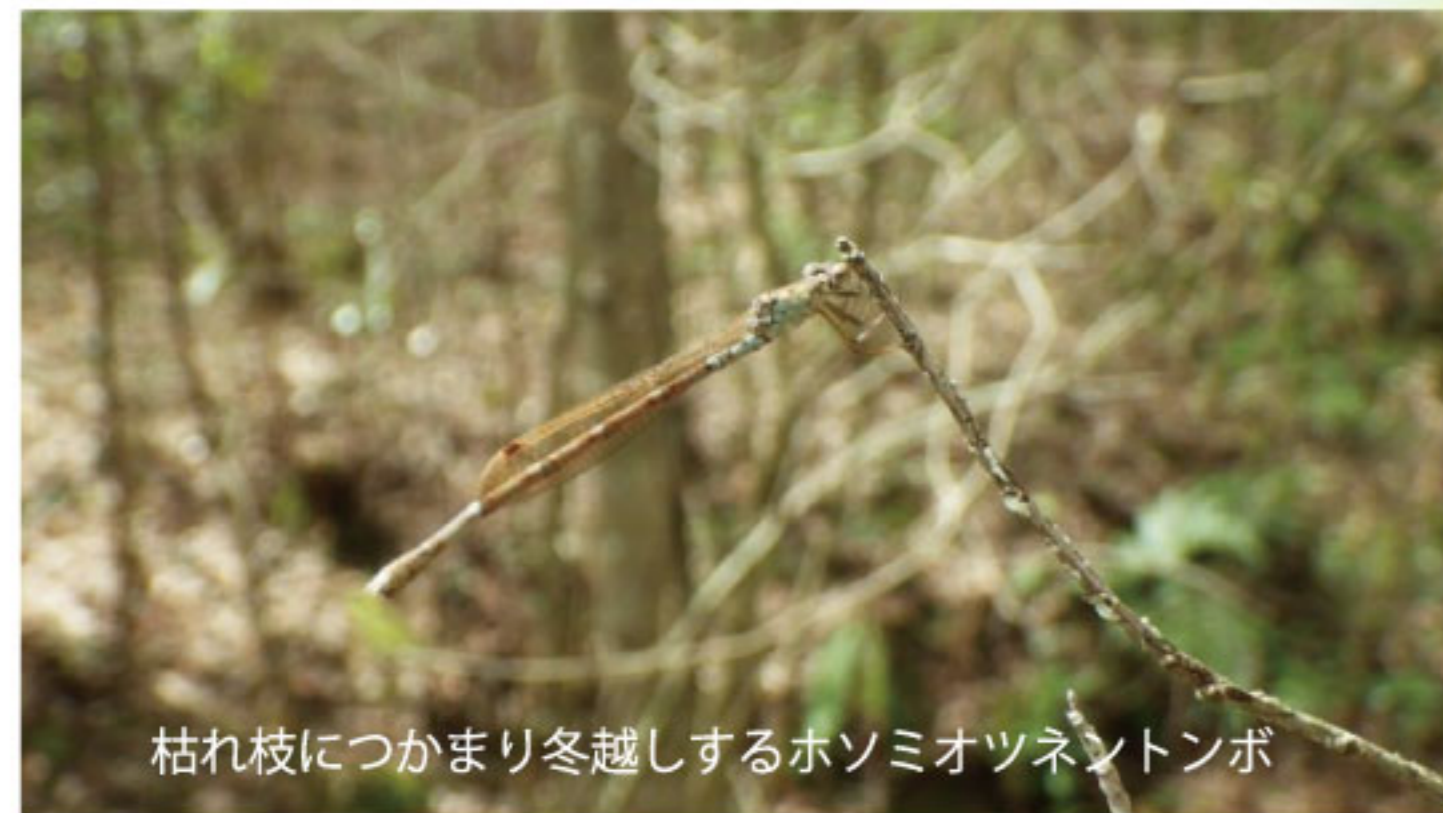
枯れ枝につかまり冬越しするホソミオツネトンボ

12月になると気温も下がり、秋の間にぎやかにしていた虫の姿は消えてしまったようにも感じます。しかし、虫たちは様々な姿で冬を乗り越えていたり、冬の寒さに負けずたくましく生きています。「虫の冬越し」といってもその様式は色々で、成虫で冬を越すものや蛹（さなぎ）でじっと春を待つもの、卵で寒さを凌ぐものなど実に多様です。