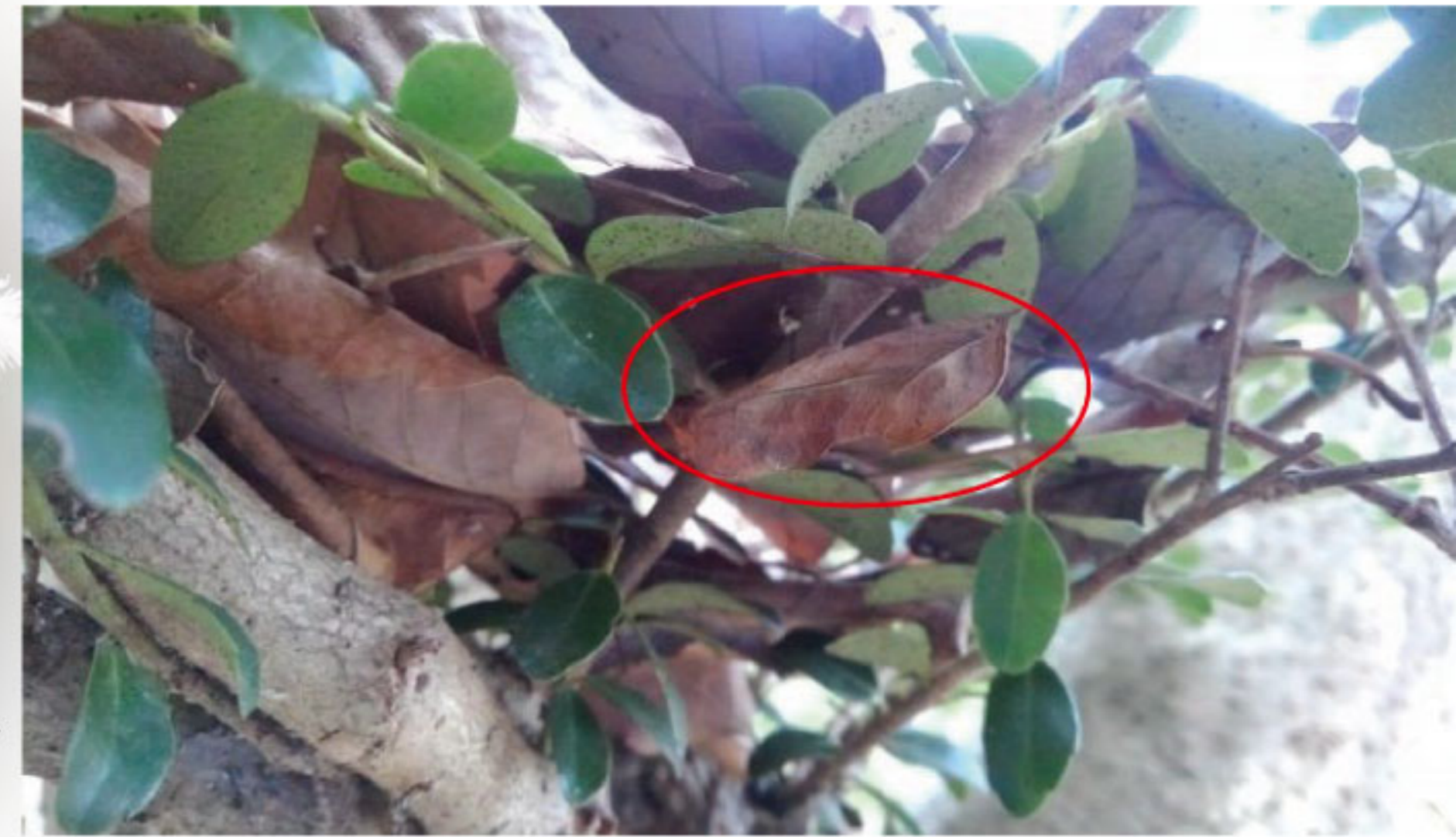
落ち葉に紛れたアカエグリバの成虫→葉っぱそっくり

また、冬越しをしている間はほとんど動くことができなくなるため、敵に見つからないことも重要です。テントウムシのように木の幹の割れ目に潜り込んだり、ぐるりと巻いた葉の中に身をひそめたりとそれぞれに工夫を凝らしていますが、枯れ葉そっくりな姿で落ち葉に紛れるチョウやガはじっとしていると一筋縄では見つけることができません。