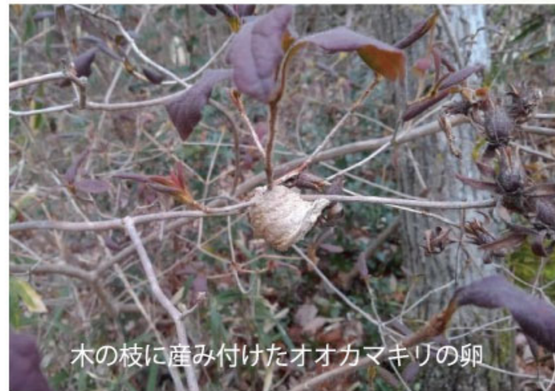
木の枝に産み付けたオオカマキリの卵