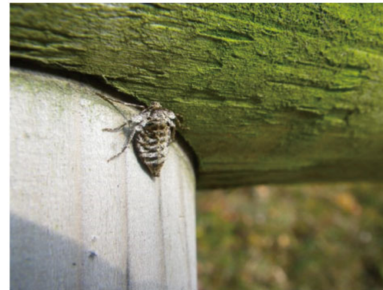
↑クロスジフユシャク（メス）木の幹や手すりなどでよく観察できる