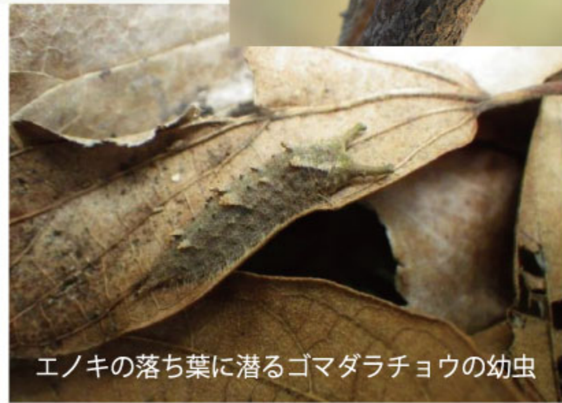
エノキの落ち葉に潜るゴマダラチョウの幼虫

また、冬越しをしている間はほとんど動くことができなくなるため、敵に見つからないことも重要です。テントウムシのように木の幹の割れ目に潜り込んだり、ぐるりと巻いた葉の中に身をひそめたりとそれぞれに工夫を凝らしていますが、枯れ葉そっくりな姿で落ち葉に紛れるチョウやガはじっとしていると一筋縄では見つけることができません。