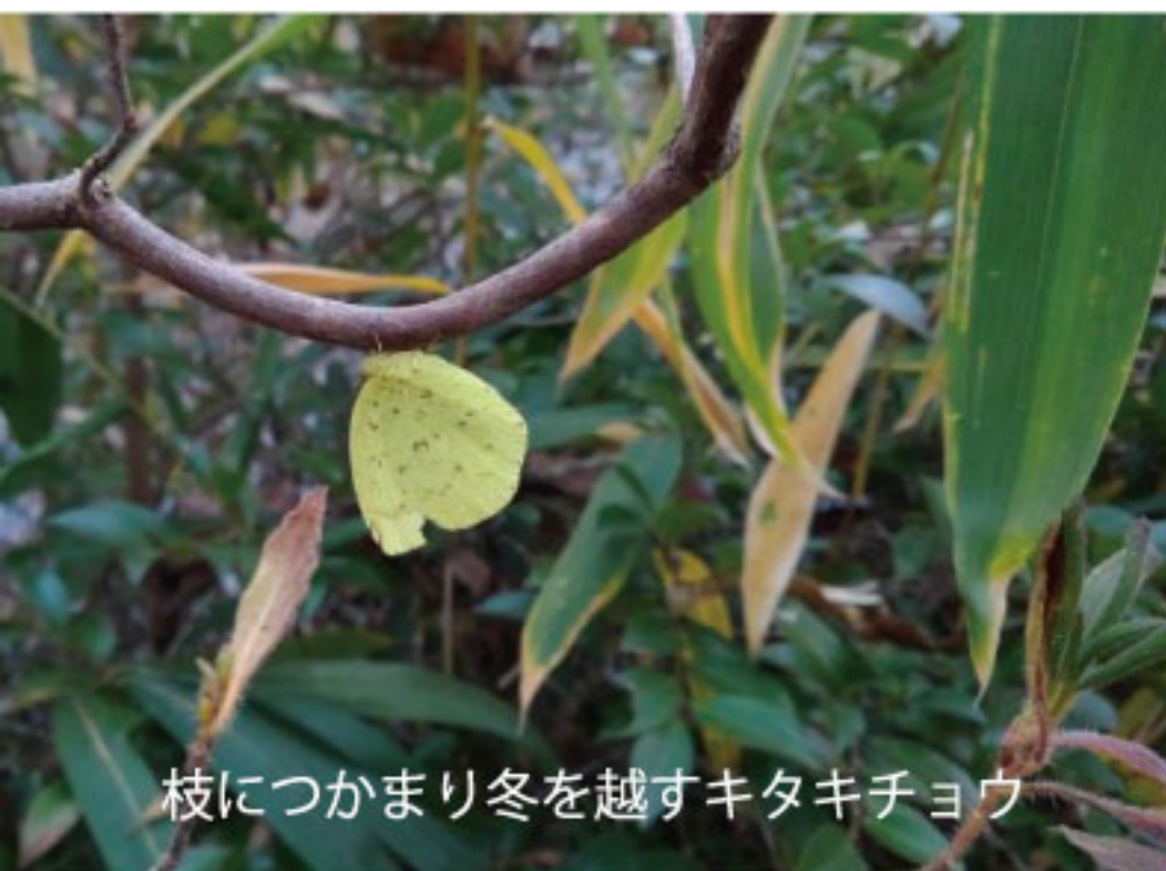
枝につかまり冬を越すキタキチョウ