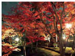
紅葉ライトアップ(11月中下旬) 写真スポットとして人気です。