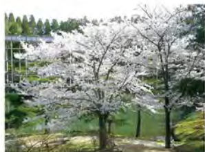
ソメイヨシノ (4月初旬) 春の庭園を彩ります。

鯉 が泳ぐ姿を見下ろしながら、庭を一望できる観月橋が特徴。庭園をかざる、四季折々の花や紅葉を楽しむことができます。格子状に演出された観月楼は、京町屋をイメージした建築物。屋内外にアート作品が展示されています。ギャラリー月の庭や、相楽木綿伝承館があります。土日祝には、森のカフェながたんが出店。