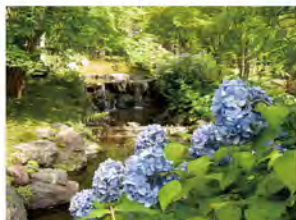
アジサイ (6月中下旬) 様々な品種が各所に点在します。