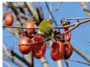
カキノキの実を食べるメジロ (12月)各所でみられます。