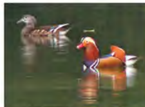
オシドリをつがい(11月~2月) 対岸から静かに眺めましょう。