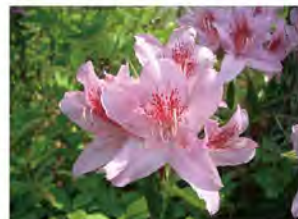
モチツツジ (5月初旬) 森の各所に群生しています。

公 園面積の約60%を占める、自然林と永谷池。周遊路は約1.2km、約30分。森の中や池際の散策が楽しめます。春はツツジが森全域に咲き誇り、新緑に包まれます。夏は水面がキラキラと輝き、木漏れ日の下、セミの鳴き声が響きます。秋はどんぐり・落ち葉拾いを楽しめます。冬はマガモ等の冬鳥を観察できます。